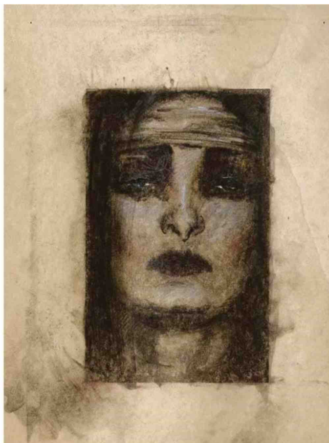
There She Goes Again , 2016.