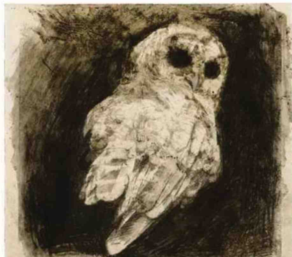
Read Into My Black Holes, 2016. A. MOLE COURT. GALERIE AIR DE PARIS

à la Ménagerie de verre, 12-14, rue Léchevin, 75011.