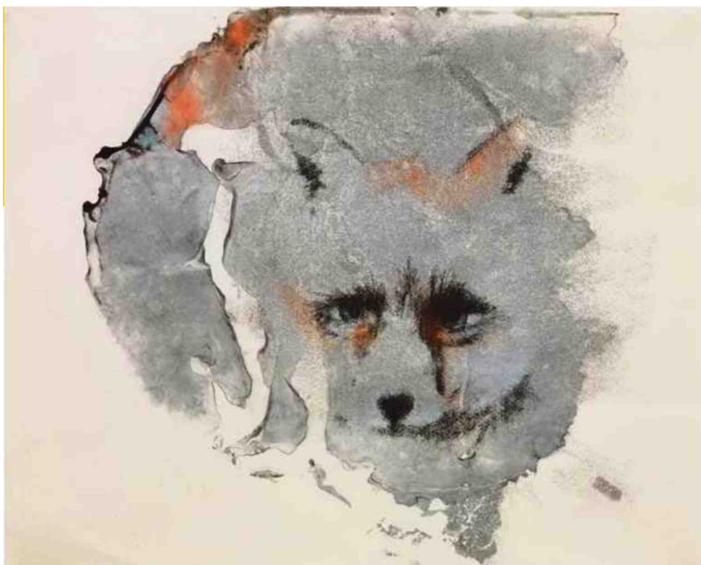
Mlle Fox , 2016.